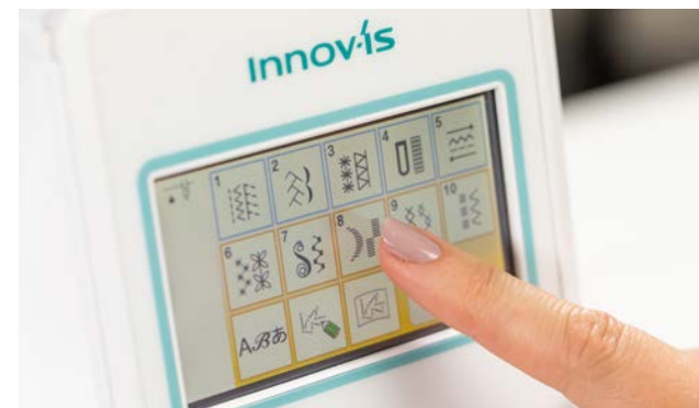
Ecran tactile LCD couleur