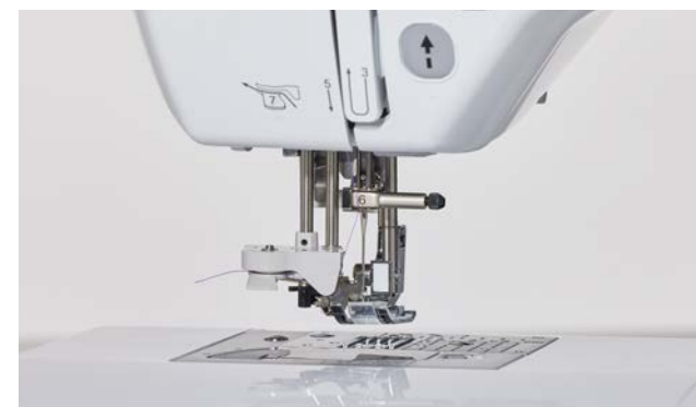
Système d'enfilage de l'aiguille extra-avancé