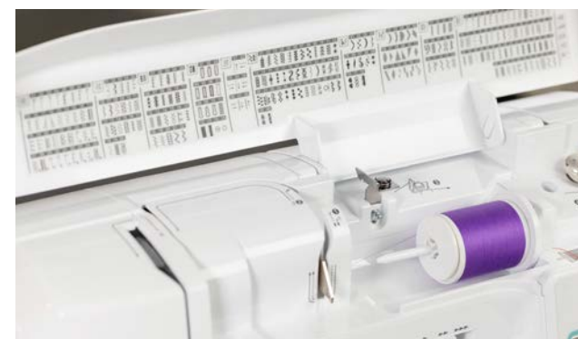
241 points de couture utiles et décoratifs intégrés